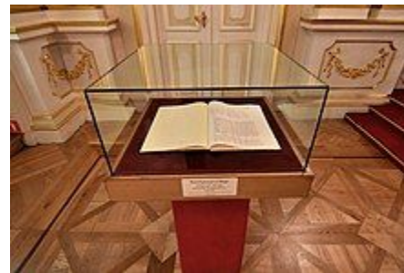
Kopia Konstytucji 3 maja eksponowana w Sali Senatorskiej