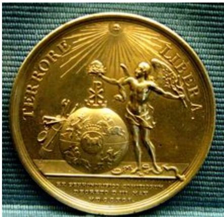
Medal wybity w 1791 z okazji uchwalenia Konstytucji 3 maja